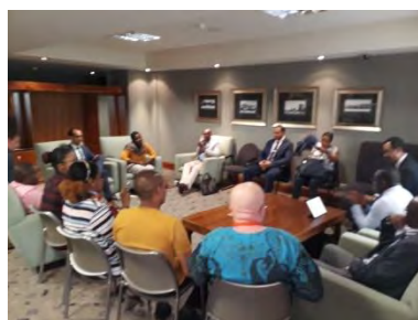
Réunion de Travail de la délégation de Mayotte avec le service économique de de l'ambassade de France