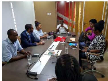
Réunion de travail SMART CODE