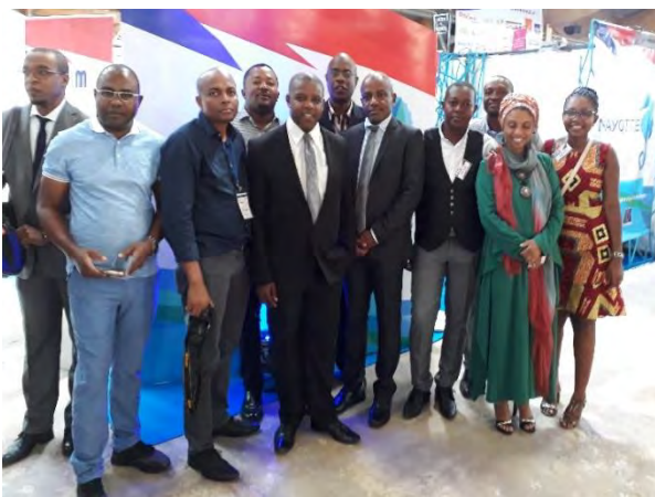
Délégation de Mayotte à la 12 ème édition de la FIM 2017