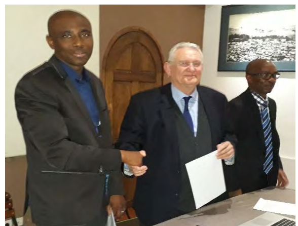
Signature de la convention de partenariat entre la CCIFM et l'ADIM FIM 2017