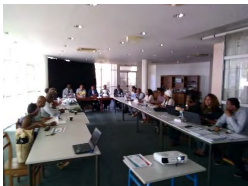
Présentation de la délégation au monde économique