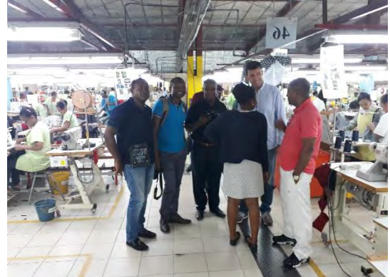
Visite d'usine de textile à Madagascar à la FIM 2017