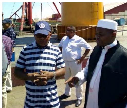
Visite du port de Majunga