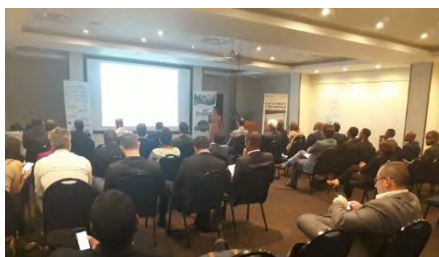
Conférence « développement Export »