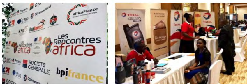
Dans ce contexte, l'ensemble de la délégation, entreprises comprises, a été convié dès le lendemain par le Premier Secrétaire (SP) du Ministère de l'Industrie, grâce à l'initiative de la KNCCI (Chambre de commerce)