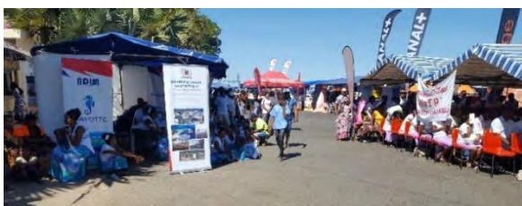
Ouverture de la foire