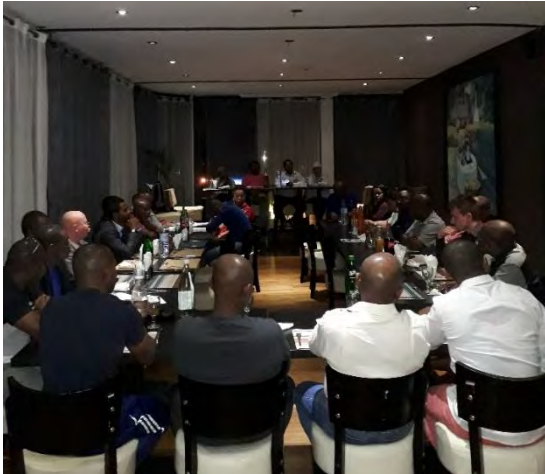
Séance de travail – Présentation des opportunités d'affaires à Madagascar FIM 2017