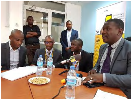
Réunion de Travail CCI Tanzanie