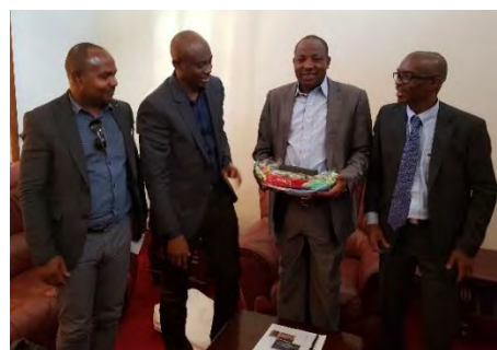
Rencontre Maire de Dar Es Salaam