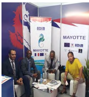
Stand de la délégation de Mayotte