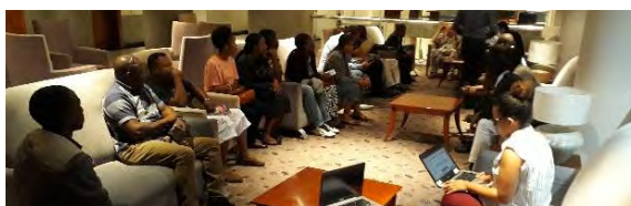
Réunion de la délégation de Mayotte avec l'APME